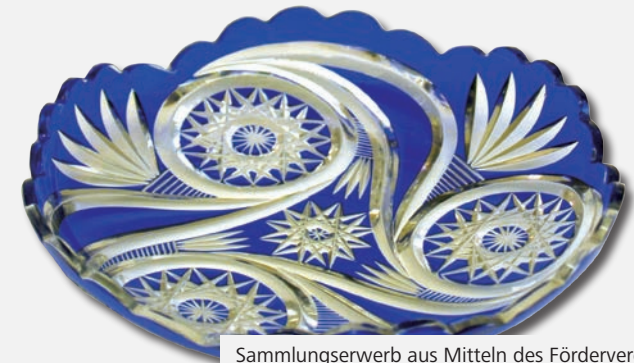
Sammlungserwerb aus Mitteln des Fördervereins